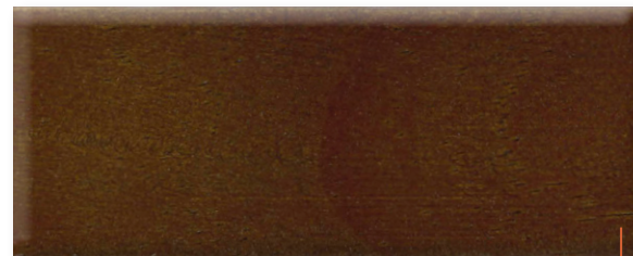
DEN HAAG 106